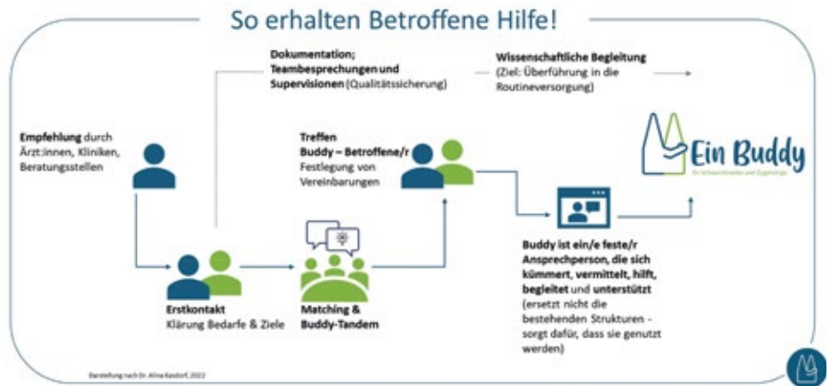
Abb. 1: Ablauf der Unterstützung für Betroffene

Eine Caring Community – die sorgende Gemeinschaft – lebt von Menschen, die sie mit Wissen, Haltung und Verantwortung tragen. Sie braucht Menschen, die bereit sind, hinzusehen: mit Aufmerksamkeit und Empathie. Menschen, die spüren, wo jemand Hilfe braucht, und wo Selbstbestimmung und Würde unantastbar bleiben müssen. Die Buddys sind Caring Community in gelebter Form. Sie unterstützen Schwerstkranke und ihre Zugehörigen nach der Diagnose einer lebenslimitierenden Erkrankung.